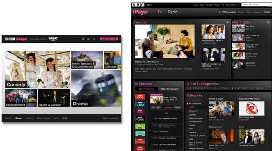
[그림 3] Global iPlayer와 BBC iPlayer의 UI 비교

BBC가 보유하고 있는 방대한 과거 콘텐츠들은 Global iPlayer의 핵심적인 특징이지만, non-BBC 콘텐츠까지도 흡수하는 것이야말로 영국 문화의 진수를 보여줄 수 있는 중요한 전략이 될 것이다. non-BBC 콘텐츠는 Global iPlayer 편성의 10%를 차지하고 있으며 6) , BBCW는 DRG 7) 와 같은 독립배급사와 계약을 맺어 영국의 인기 TV 프로그램을 2012년 초부터 제공하고 있다. 8) 이러한 다양한 콘텐츠 전략을 통해 Global iPlayer는 콘텐츠의 폭을 넓히고 영어권 국가, 영국인 시청자에게 보다 나은 서비스를 제공할 수 있을 것이다.