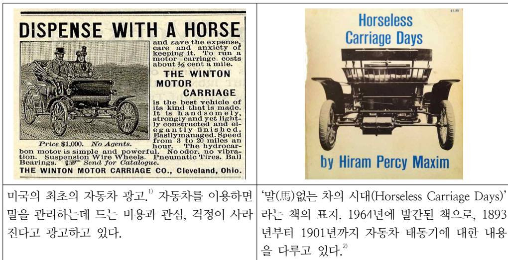
[그림 1] 말(馬)이 없는 차

19세기 말, 자동차는 동력(動力)의 변화를 통해 새로운 산업을 열었다. 대중적 운송 수단이 마차(馬車)에서 자동차로 전환된 것이다. 당시 자동차의 이름은 ‘말(馬)이 없는 차(Horseless carriage)’였다. 120여년이 지난 오늘날 ‘운전자(driver)’가 없는 자동운전 자동차(Driverless car, Autonomous car)가 시도되고 있다. 산업혁명은 개인용 운송수단에서 말(馬)을 내연기관으로 대체했으며, 이제 정보기술 혁명은 운전자를 컴퓨터로 대체하고 있다.