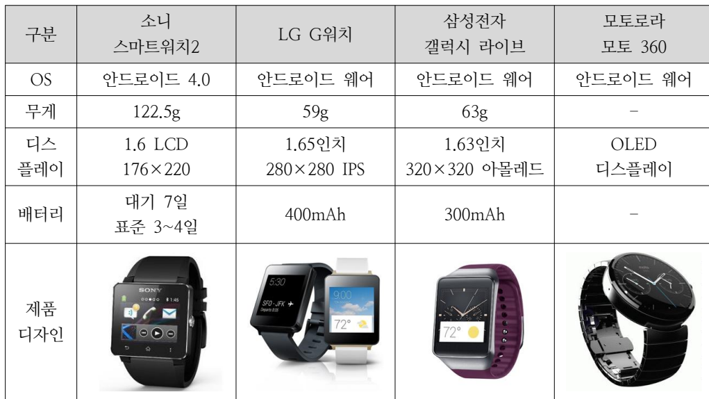
<표 2> 주요 스마트폰 제조사의 新스마트워치 비교

한 소재의 시계줄로 교체가 가능해 고급화 한 것이 특징이다. 사파이어 글라스로 보호되는 OLED 디스플레이가 탑재되며 자기공명 무선충전 지원, 온-스크린 알림, 음성 인식 기능인 ‘OK 구글’ 등을 지원할 것으로 알려졌다. 충전 방식은 USB충전방식 이외에 새로운 충전방식을 제공할 것이라고 밝힌 바 있다.