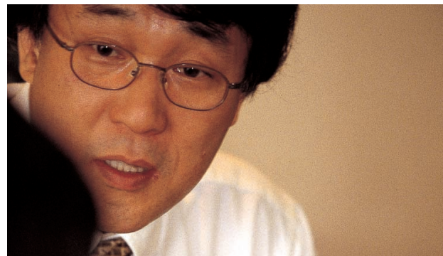
정보통신정책연구원 원장 이주현

우리나라 IT발전의 든든한 버팀목으로, 나아가 대원칙을 도출하고 미래의 큰 그림을 그리는 국가적 핵심 두뇌로 우뚝 서겠습니다. 앞으로 20년도 기대해 주십시오.